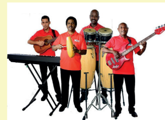
LOS 4 DEL SON Salsa, Merengue, Bachata, Son "La Dolce Vita" / Obere Marktstraße 3 + 4