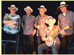
PETITE FLEUR Jazz & Blues Band "Via Toni" / Georg-August-Zinn-Str.42