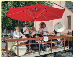
AUTMUNDIS SWINGTETT Swing & Dixie Parade / Marktplatz