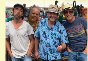
LOS MANOLOS Folk-Rock-Americana "Weinscheune Emmerich" / Wallstraße 29