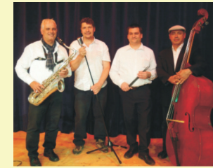
NOBBY & THE BOBCATS Rock'n'Roll, Oldies, Schlager & Swing "Bistro du Chateau" / Markt 4