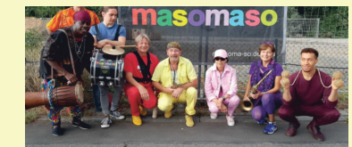
MASOMASO Rumba, Salsa, Funk, mal Swing, Jazz-Standards bei der Parade und danach auf dem Marktplatz