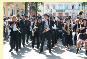
MARCH MELLOWS STREETBAND BluesJazzSwingSoul Parade & Marktplatz