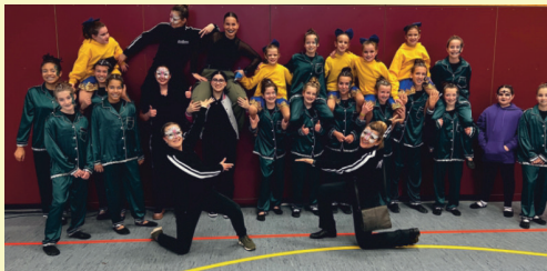
FABDANCE COMMUNITY Tanzgruppe

Die Parade startet um 16 Uhr am Bahnhof und führt über die St. Peray-Straße, die Carlo-Mierendorff-Straße, die Georg-August-Zinn-Straße und die Obere Markt-Straße zum historischen Marktplatz.