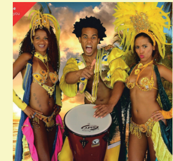
BAHIA DANCE GROUP Samba