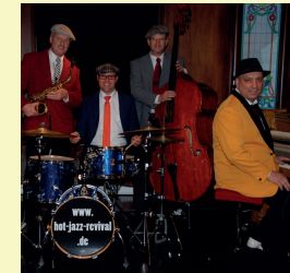
HOT-JAZZ-REVIVAL BAND Swing, Bossa Nova Boogie Woogie Standard "Goldene Krone"/ Markt 7