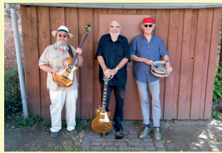
BLUESPAPAS Blues & Swing "Umstädter Brauhaus" Zimmerstr. 28